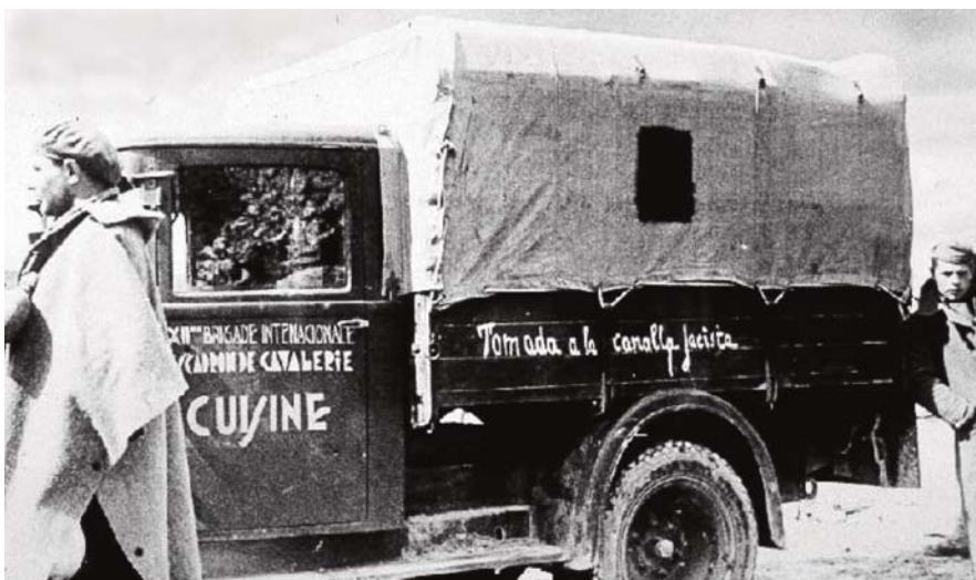
La camionetta dell'intendenza usata nella battaglia di Guadalajara dallo squadrone di cavalleria della XII Brigata Internazionale: era stata "sottratta alla canaglia fascista" (sic).

La battaglia di Guadalajara è la prima grande battaglia vinta sul fascismo nel mondo ed anche l'ultimo grande trionfo delle forze repubblicane e antifasciste in Spagna. La vittoria fu possibile grazie alle Brigate Internazionali.