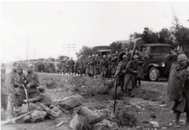
La 2.a Divisione del CTV sulla strada di Aragon.