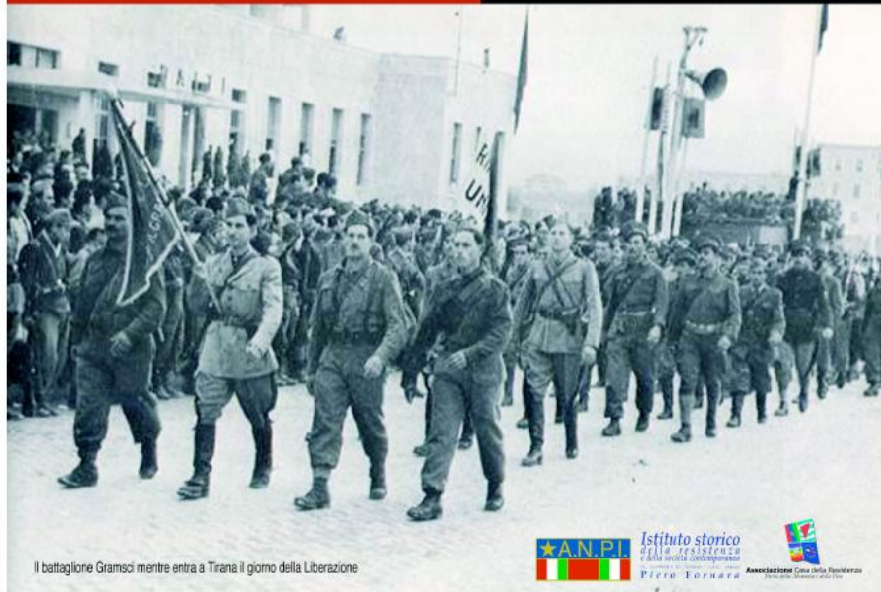
Il battaglione Gramsci mentre entra a Tirana il giorno della Liberazione

Casa della Resistenza Via Turati 9 Verbania Fondotoce