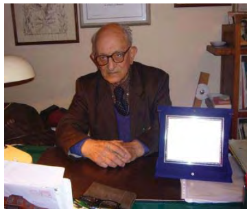
Linguaglossa 25 ottobre 2010