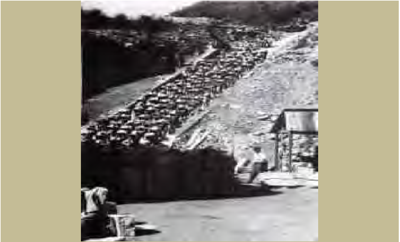
La "scala della morte" nel Lager di Mauthausen

VERDE delinquenti comuni VIOLA Testimoni di Geova ROSA omosessuali NERO "asociali" STELLA GIALLA ebrei MARRONE "zingari" BLEU apolidi