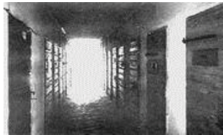
Cella della morte – Bolzano Gries

Si stima che a Bolzano Gries siano transitate 11.116 persone. All'atto della liberazione, fine aprile 1945, nel campo si trovavano ancora 3500 persone. Almeno 50 persone sono morte a cause delle violenze subite e per fucilazioni.